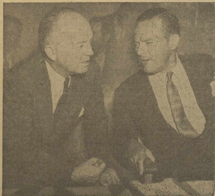
Henry Cabot Lodge, representante permanente de los Estados Unidos en las Naciones Unidas y hermano del actual embajador de aquel país en España, John Davis Lodge, consulta con Harold E. Srasen, ayudante especial del presidente Eisenhower para el desarme, durante una sesión de la Comisión de Desarme de las Naciones Unidas que actualmente se halla reunida en su sede de Nueva York.