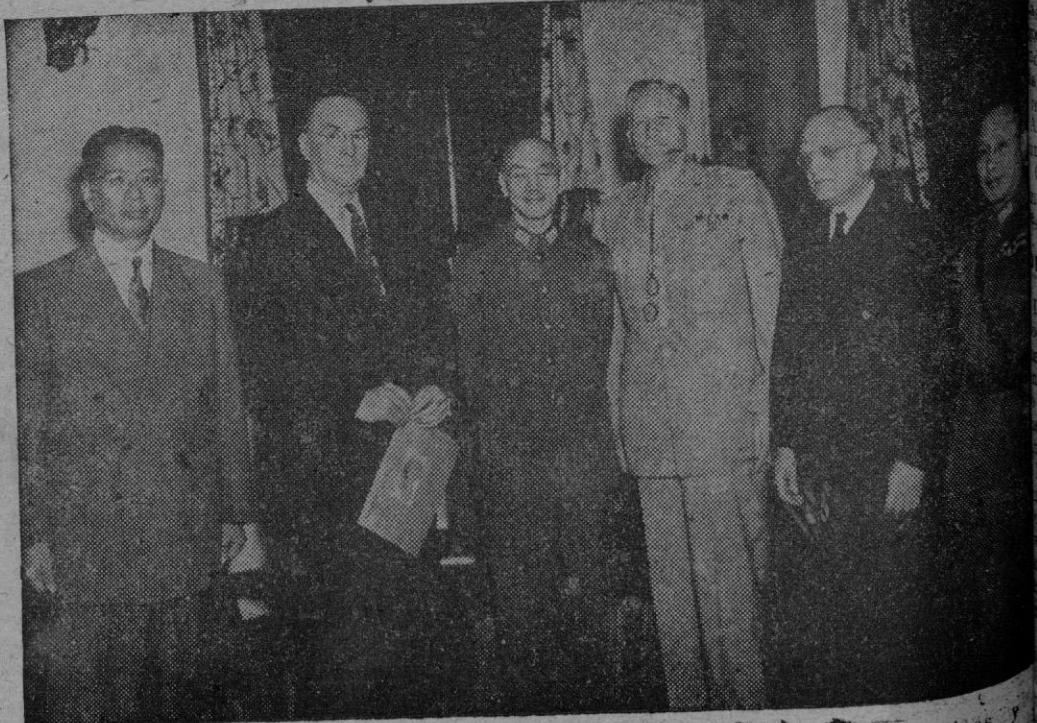
Después de una recepción oficial en Chungking, las personalidades chinas y americanas posan ante el fotógrafo durante una visita de una misión especial militar y económica norteamericana.

El comentarista de Angora dijo finalmente que un importante periódico de la ciudad resumía el estado general de la opinión en la siguiente frase que encabezaba un artículo editorial: "No estamos dispuestos a pagar la amistad rusa con un trozo de nuestro suelo".