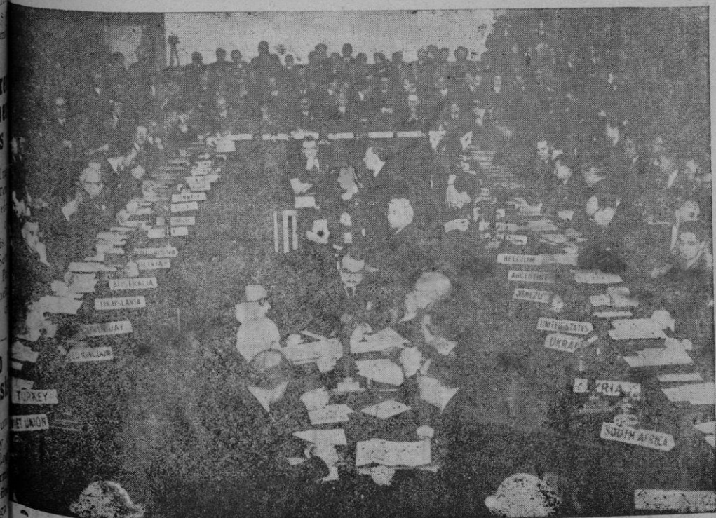
Reunión de la comisión preparatoria de la Asamblea de las Naciones Unidas (U.N.O.), celebrada en Westminster