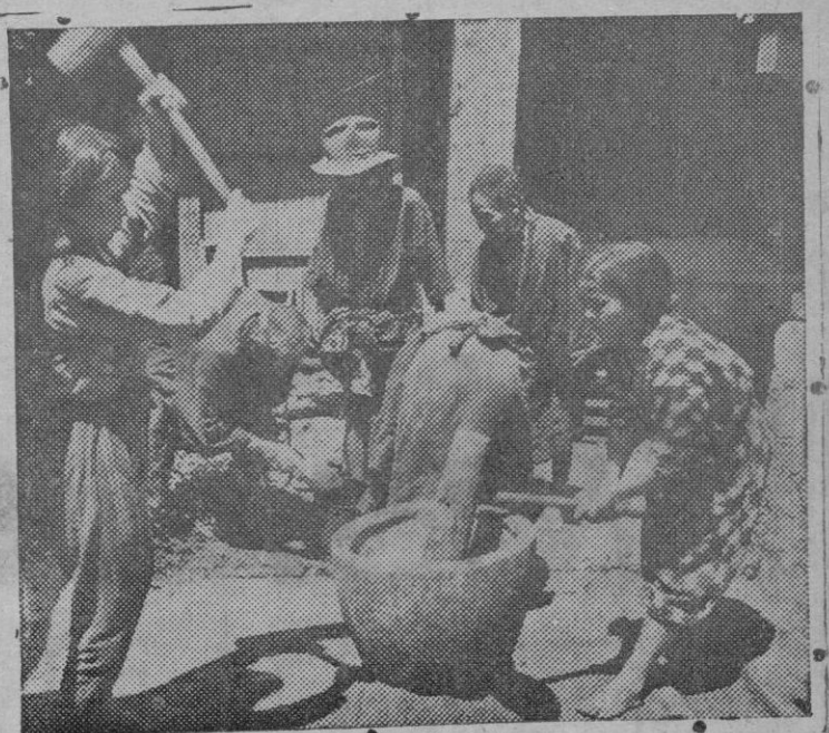
Ciudadanos de Okinawa se disponen a preparar una comida en un campo de refugiados.