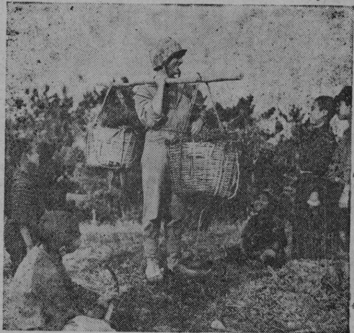
Un soldado americano de infantería de Marina divierte a unos muchachuelos de Okinawa imitando a los portadores de cestos

Esa medida prácticamente va dando resultados, pues ascienden ya a 30.000 los presupuestos presentados para optar a tales beneficios, para los que el Estado ha destinado cerca de 700 millones.