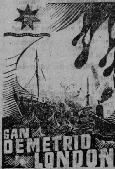
La auténtica historia dramática de un petrolero inglés