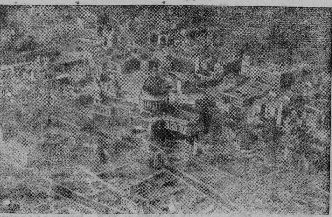
Un sector de la capital londinense junto a la Catedral de San Pablo, que muestra los daños causados por los bombardeos alemanes.