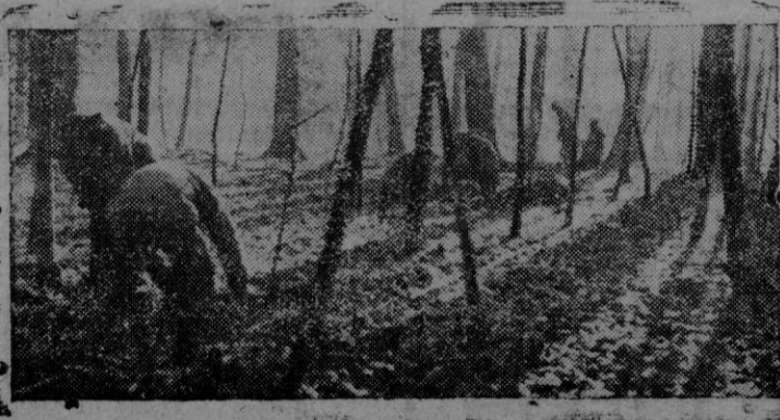
Soldados norteamericanos cavando trincheras en un bosque, situado en las líneas avanzadas del frente