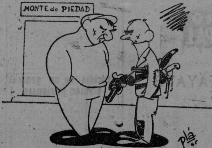
EL PISTOLERO. — ¡Ah! compañero. Aquellos tiempos de antes de la guerra sí que eran buenos. Yo voy a ver si empeno mis herramientas para ir tirando. Está el negocio muy parado.

"Franco ha evitado las terribles matanzas que ocurren en otros puntos de Europa, bajo el comunismo."