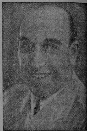
Las dos prestigiosas figuras que al frente de su compañía debutan hoy en el Teatro Principal