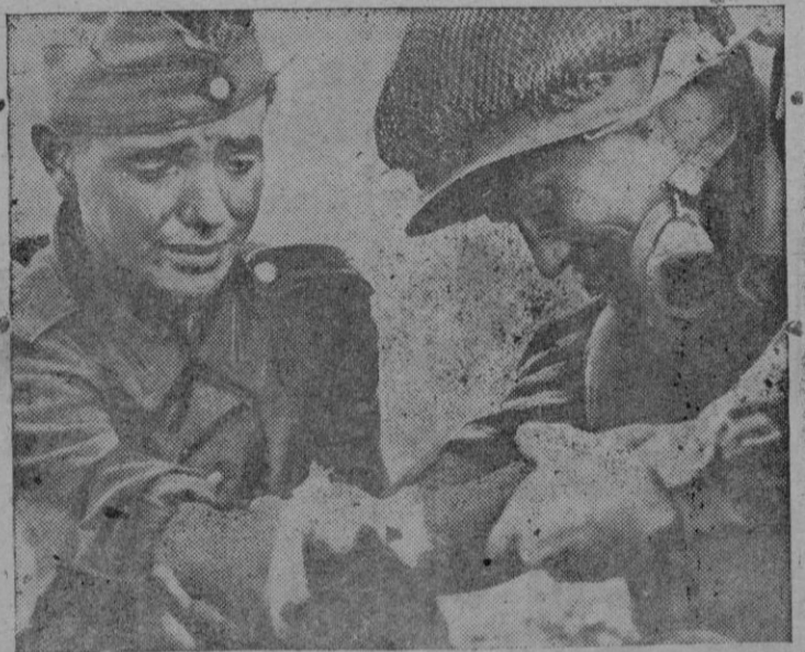
Un soldado americano aliado al brazo herido de un soldado alemán, mientras llega el Sanitario del Ejército americano