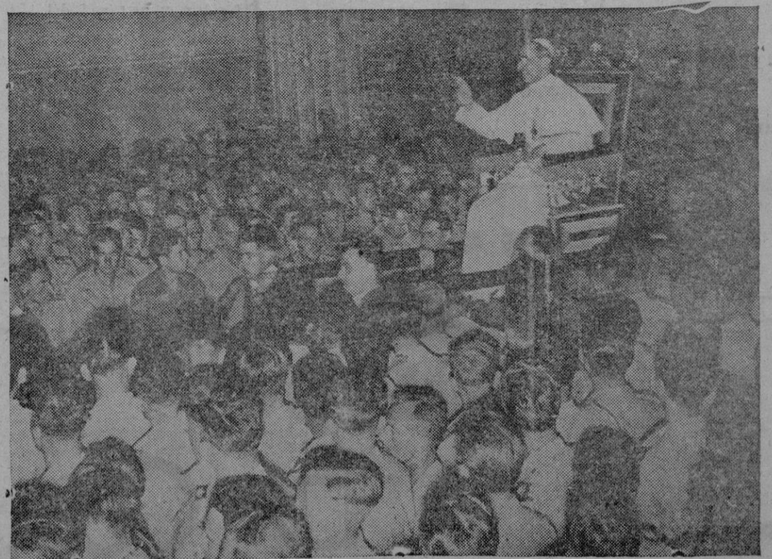
S. S. el Papa Pío XII otorga su bendición a una multitud de soldados aliados en el Salón del Trono del Vaticano, después de una audiencia y misa especial para los soldados de la 78 División Inglesa