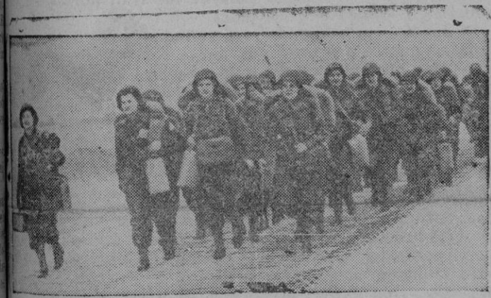
El primer destacamento del Ejército Femenino desembarca en Francia y se dirige a los camiones que han de llevarlas a sus puestos.