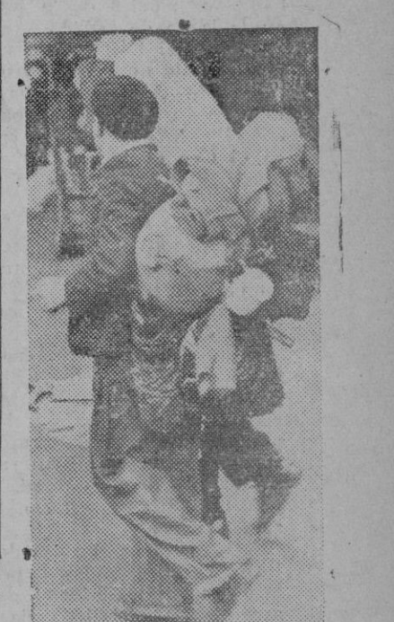
Dos refugiados franceses llegan a Londres, desde los campos de batalla de Normandía

convenios internacionales sobre la materia.