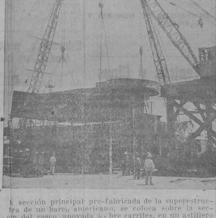
La sección principal pre-fabricada de la superestructura de un barco americano, se coloca sobre la sección del casco, apoyada sobre carriles, en un astillero de los EE. UU.