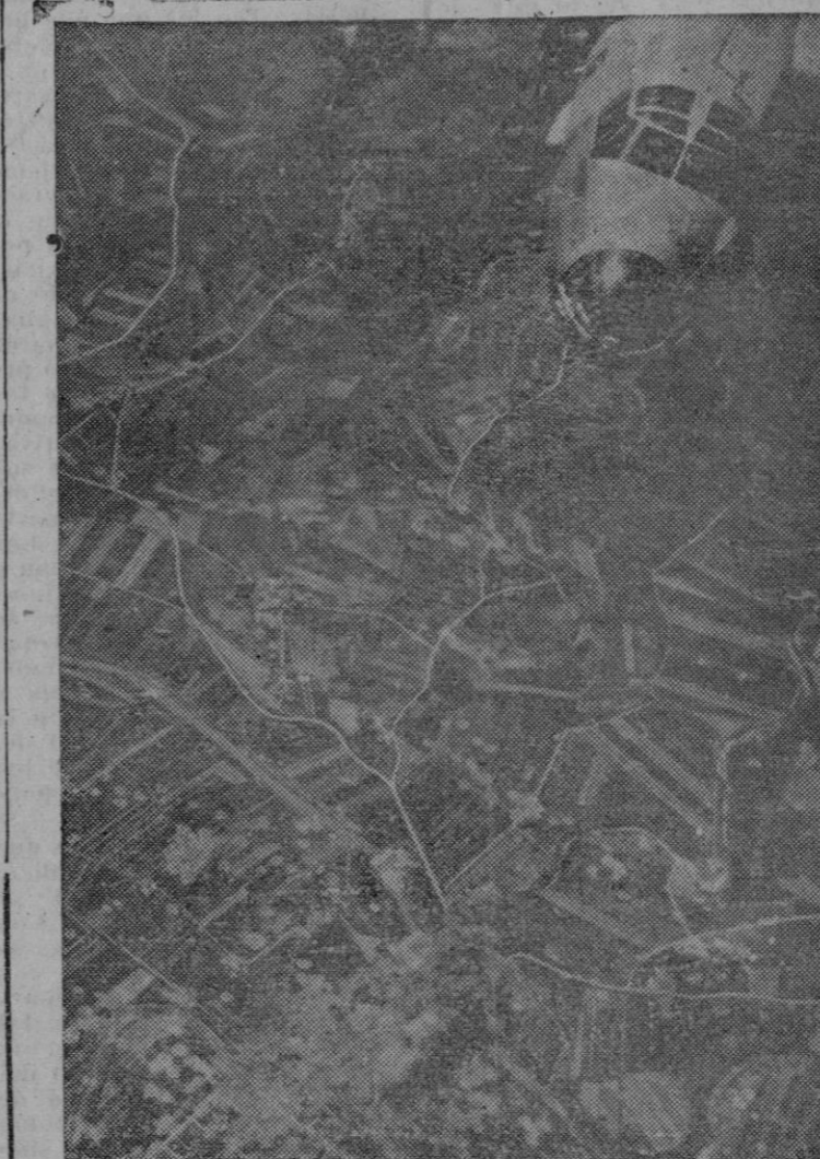
Un bombardero se aleja después de haber bombardeado las comunicaciones alemanas

Gran Cuartel General del Cuerpo expedicionario. — Comunicado: Después de los combates intermitentes librados entre Samsay y Noyers, los aliados han logrado nuevas ganancias de importancia, apoderándose de una altura. Al norte de Remilly y al sur de Lozón, hemos penetrado en los pueblos La Samsayerie y Labbaye que se encuentran ahora firmemente en nuestro poder. En la margen oeste del río Vire ha sido efectuado un avance de mil 600 metros al sur de Le Mesnil Durand. Ha sido conquistada Martin-