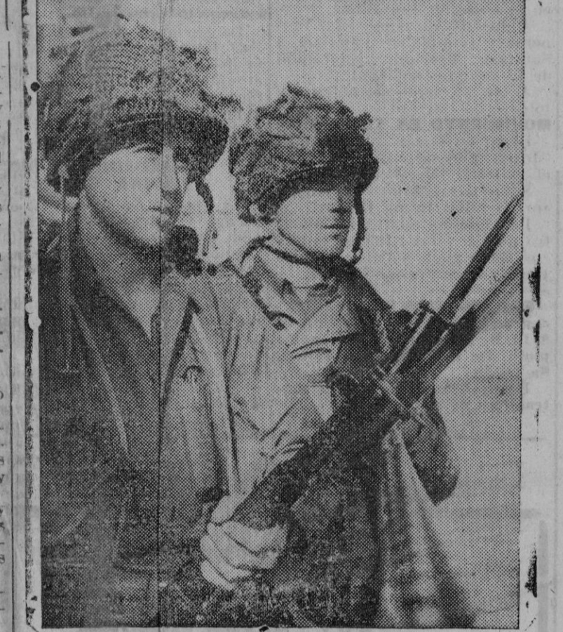
Dos soldados norteamericanos de Infantería de los primeros desembarcados en Francia