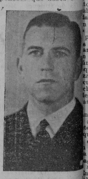
El contralmirante Wilkes, de la Marina norteamericana