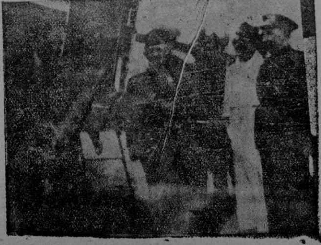
Federico de MENDIZABAL

Y así, asomándose el alma con un reflejo inmortal a las pupilas inmóviles, de una fijiza tenaz, tiene miradas de estrellas desde ahora, el capitán!