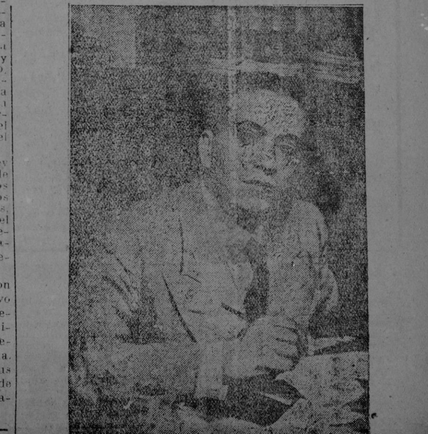
El protomártir don José Calvo Sotelo