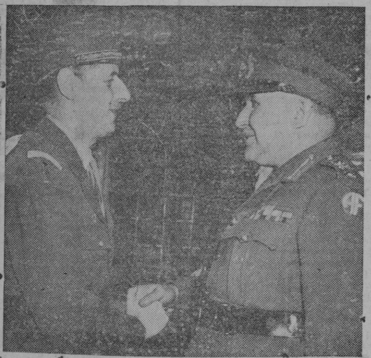
Generales aliados. — El general inglés Sir Henry Maitland Wilson (derecha), general en jefe de las fuerzas aliadas en el sector del Mediterráneo, saluda al general de Gaulle