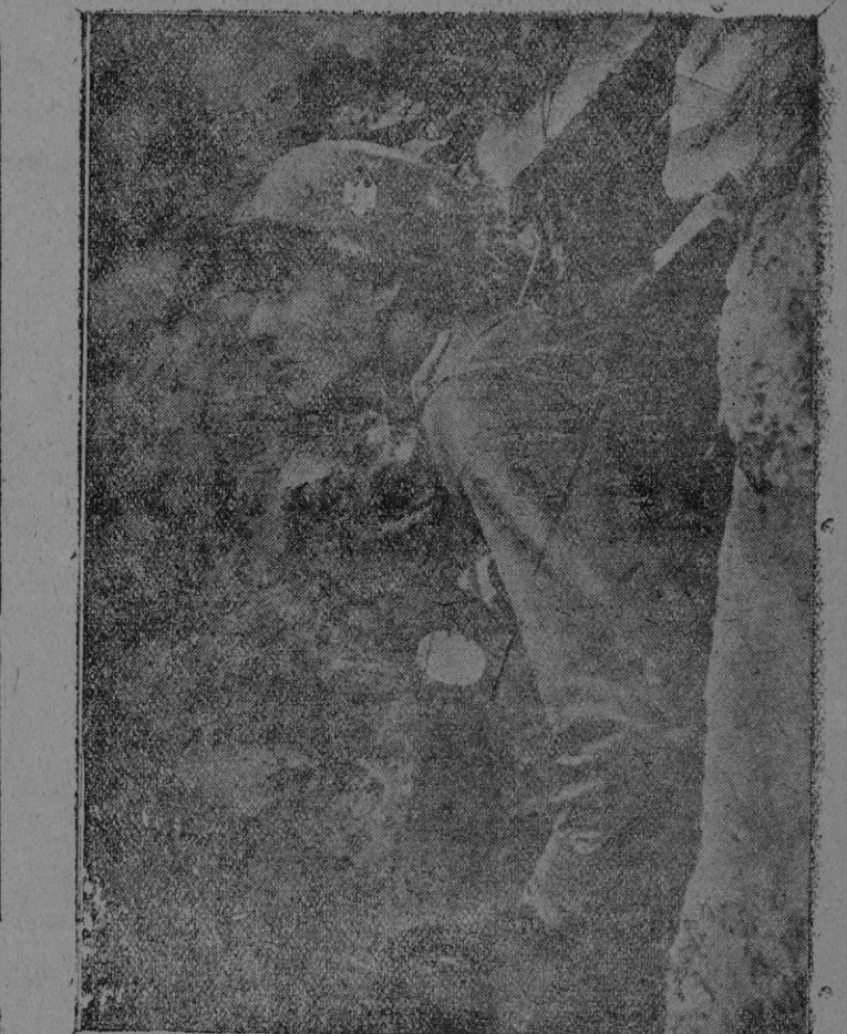
El jefe de un destacamento alemán espera, en la entrada del fortín, el avance de los tanques adversarios

Se estudiará también la cuestión de la monarquía griega.