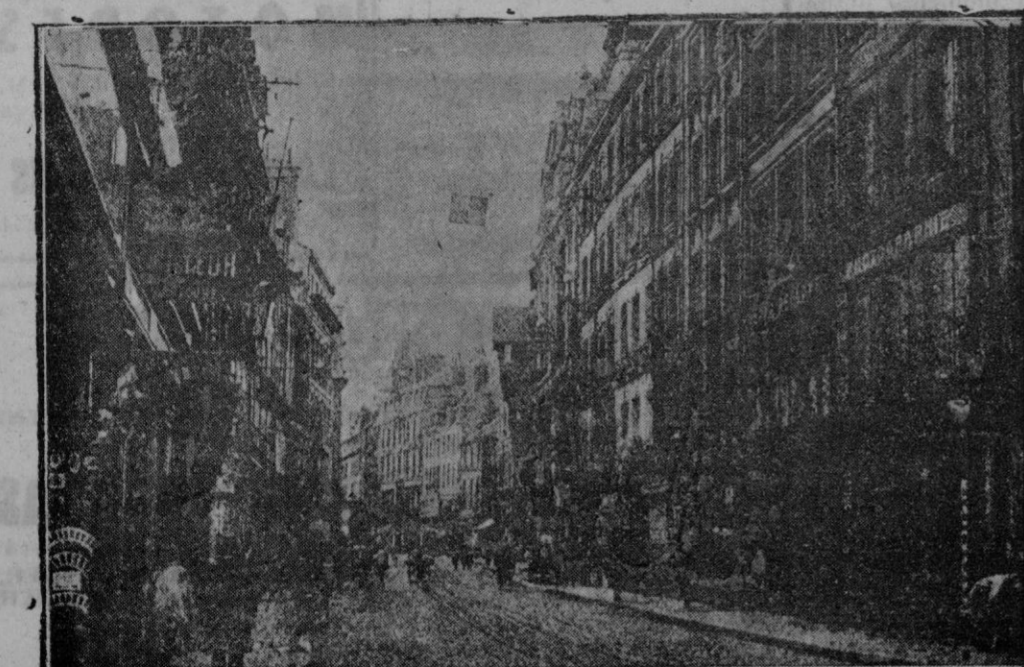
Una de las principales vías de Caen, población que los alemanes defienden con éxito