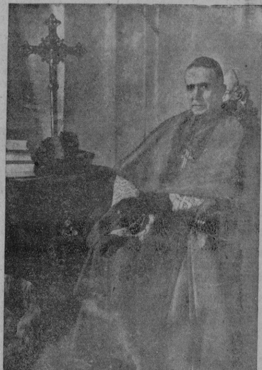
Nuestro ilustre paisano el Obispo de Vich, P. Perelló, que el domingo celebró sus bodas de oro sacerdotal. La prensa de Cataluña publica su fotografía que, por lo reciente; ofrecemos a nuestros lectores

móvil siguió viaje hasta su residencia de El Pardo, continuando el tren su marcha a Madrid con las autoridades e invitados. Paulatinamente este servicio que hoy se ha puesto en marcha, se irá incrementando dentro lo posible con el aumento del número de trenes. Para últimos del presente año se espera poder tener electrificada la línea hasta Avila. Entonces todos los trenes, aún de largo recorrido partirán de Madrid y seguirán hasta Avila por el servicio eléctrico. En aquella capital cambiarán por las locomotoras de vapor. En la primavera de 1945 se conseguirá también tener electrificada la línea de Segovia.