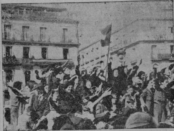
El público madrileño se lanzó a la calle hace cinco años para aclamar a las tropas de liberación