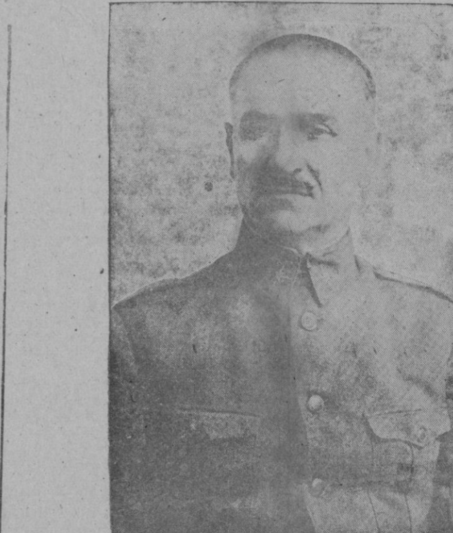
El General señor Queipo de Llano, a quien el Generalísimo Franco ha concedido la Gran Cruz Laureada de San Fernando