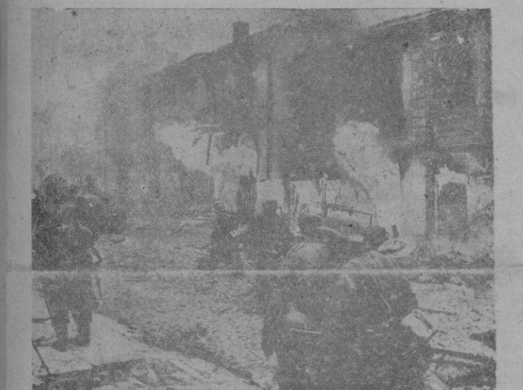
Las fuerzas del Reich recuperando la ciudad de Zitomir, en el curso de la eficaz contraofensiva alemana del saliente de Kiev

desarrolla, y proyecta en planos mucho más altos que el bajo nivel de las incomprensiones murmuradoras. (Muy bien. Aplausos). La solidaridad de todos los buenos españoles fundidos en un mismo propósito, fundidos en una misma esperanza, el propósito de mantener, cueste lo que cueste, esta santa unidad frente a cualquier fuerza disgregadora, propia o extraña, y la esperanza de un futuro cierto de una España mejor, término y premio justiciero de tanto y tanto sacrificio realizado. (Muy bien). Pero no puedo dejar de cumplir otro deber que está pesando sobre mi conciencia, como seguramente pesa sobre las vuestras; las Cortes españolas no pueden permanecer indiferentes ante el tremendo dolor de un mundo conturbado por la más grande catástrofe que conocieron los siglos.