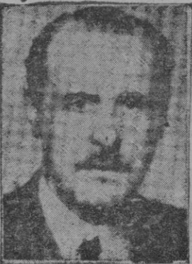
Excmo. Sr. D. Esteban Bilbao

Me permitirán los señores Procuradores unos minutos nada más para cumplir un deber que considero inexcusable. Desde luego si estas Cortes han de tener una significación especial, totalmente adversa a las características de los viejos Parlamentos, es preciso, lo dijimos en la sesión inaugural, que desafiando el arteificio propio de las democracias enderecemos nuestros esfuerzos al estudio de aquellos problemas prácticos que más hondamente afectan a la vida nacional.