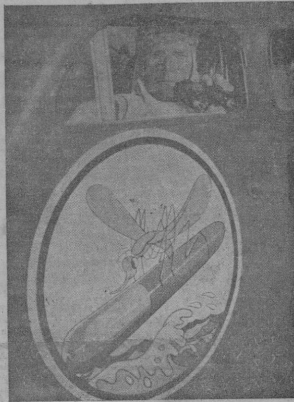
El emblema que se ve debajo de la ventana fué dibujado por el artista cinematográfico Walt Disney para la flota de "mosquitos" aliados

La isla de Samos fué ocupada por las tropas aliadas el día 25 de septiembre último.