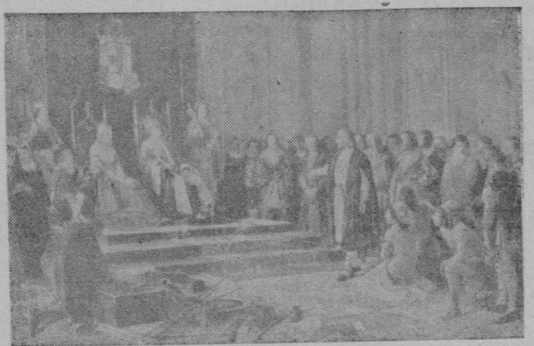
Los Reyes Católicos en el Palacio Real de Barcelona (hoy exconvento de Santa Clara), en el acto de recibir al Gran Almirante Cristóbal Colón, quien les explicó su gloriosa hazaña.