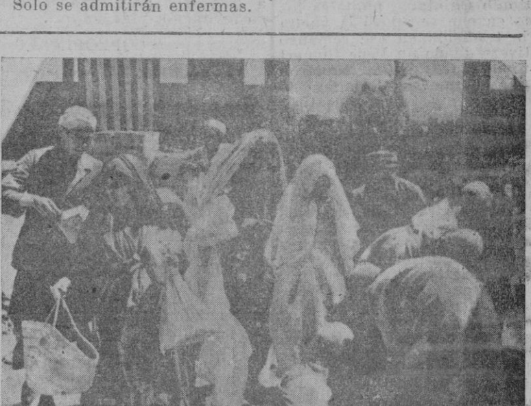
Los aliados en Túnez reparten alimentos a los indígenas

Asimismo ha quedado totalmente terminado el sanatorio de El Sabal, que admitirá trescientos enfermos de ambos sexos en la provincia de Las Palmas.