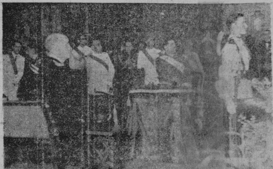
Aspecto que ofrecía el templo de San Francisco, (Presidencia de Autoridades), durante la celebración de la solemne misa