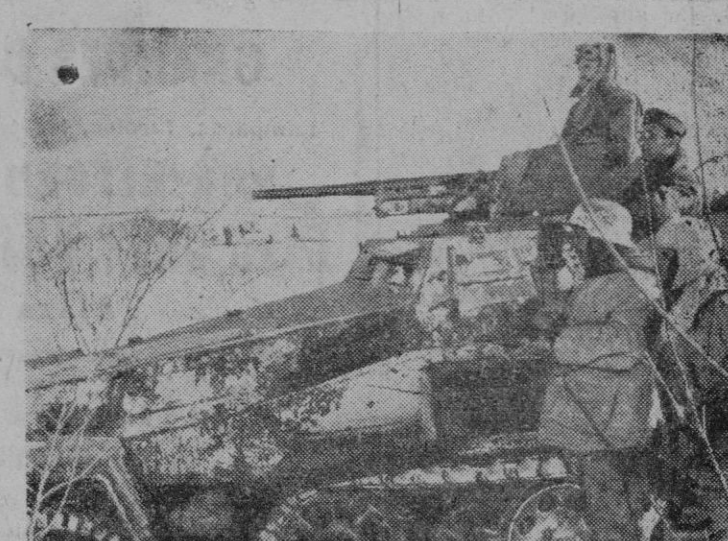
Tanque preparado para entrar en acción