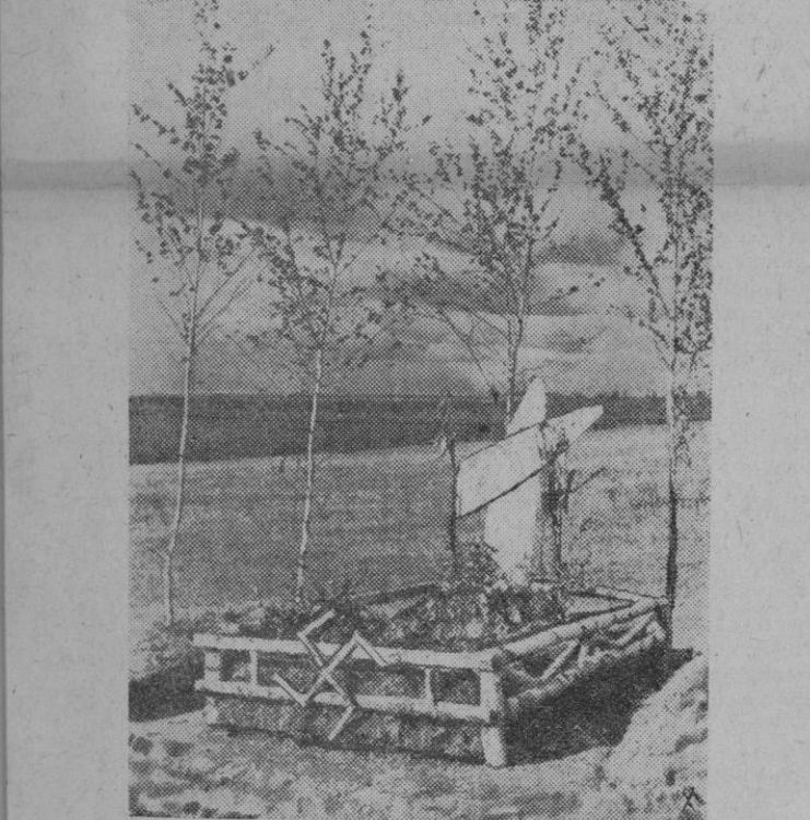
Tumba de un aviador en el frente del Este

El éxito obtenido en los cursillos últimamente celebrados, prueba la bondad del plan y el interés con que es seguido por parte de las afiliadas, que sin molestias y lejos de la rigidez de las aulas, reciben completa instrucción adecuada a los tiempos actuales.