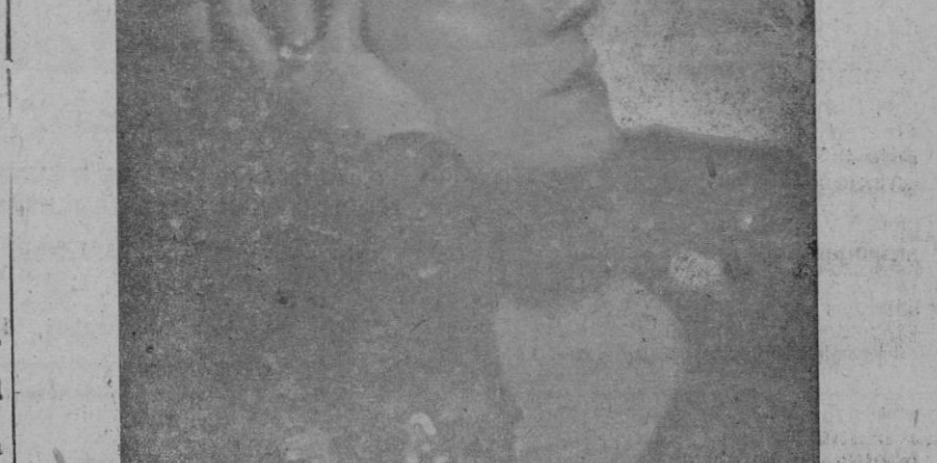
La eminente recitadora Juanita Azorín, "La Juerga", que hoy actúa en el Teatro Principal

Londres.—Dochientos ochenta y siete bombarderos británicos y 418 bombarderos norteamericanos que operaban en Gran Bretaña no han regresado de las incursiones contra Alemania y Europa occidental en el curso del mes de abril, ha declarado en los Comunes el Ministro del Aire, Sinclair.