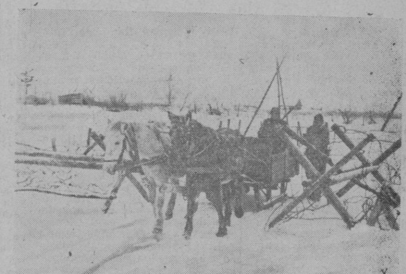
Un convoy alemán llega a las alambradas de una posición avanzada en el frente del Este

En general, la cuestión se encuentra sin decidir en los tres principales sectores de la lucha. Ambos adversarios proceden a la reorganización de sus fuerzas con vistas a futuros combates. La aviación de los dos bandos se emplea a fondo contra las comunicaciones y concentraciones enemigas, respectivamente.