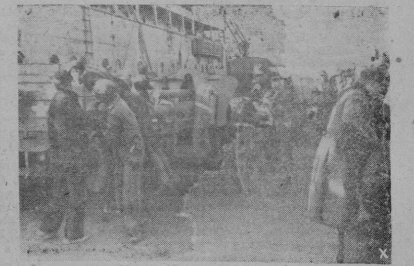
Transportando cañones a la isla de Creta para umentar su poder defensivo

Méjico. — El presidente Avila Camacho ha hecho declaraciones sobre el problema religioso mejicano problema que a su entender está resuelto, siendo normales las relaciones entre la Iglesia y el Estado. El Presidente dijo que estaba seguro de que el clero solo deseaba guiar al pueblo en su progreso espiritual.