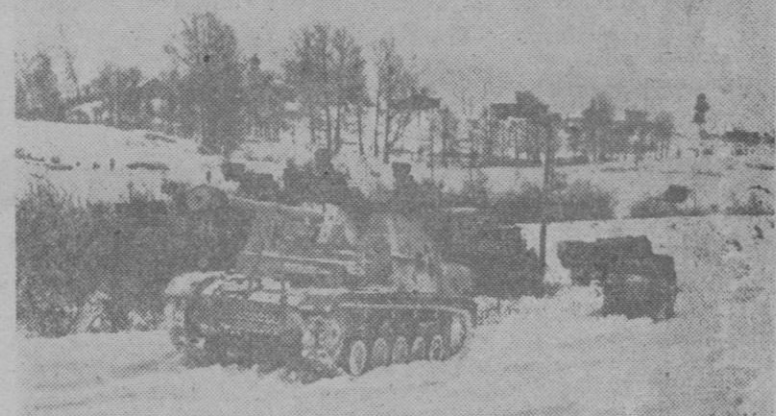
En el frente del Este, un carro blindado alemán marcha a proteger una operación