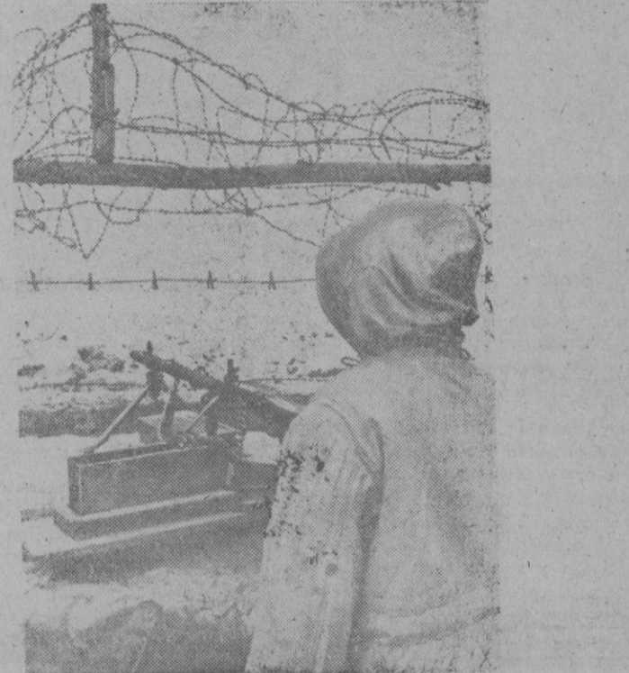
Un puesto de ametralladoras alemanas, en las avanzadas de Rusia