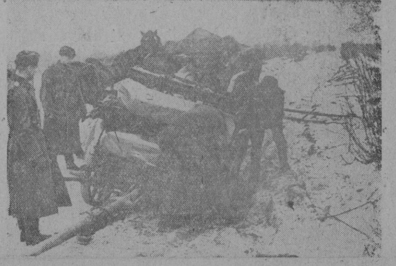
Con los soldados alemanes en el Este. - Vehículo aprisionado por la nieve

Todo esto es lo que llenará las sesiones del Consejo Nacional en el cual han de hallar las jerarquías de la Sección Femenina nuevos alientos para proseguir y mejorar la labor que tanta admiración causa en quienes la conocen y que tan eficaz es para el futuro de la Patria.