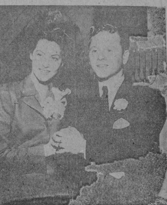
Mickey Rooney, estrella de la Metro-Goldwyn-Mayer, en compañía de su esposa, Ava Gardner

Para esta sesión, que revestirá singular importancia y solemnidad, la "Capella" ha venido preparando un magnífico programa compuesto de quince obras entre las que figuran algunas de las mejores creaciones de su repertorio no ejecutadas desde hace tiempo: "Don Juan y Don Ramón", de Pedrell, las joyas de nuestro folklore "La Balanguera" y "La Saeta", de Noguera; el brillante y difícil madrigal de Debussy "Yver, vous n'estes qu'un vilain" (texto del s. XV que la Capella canta en su idioma original); etc.