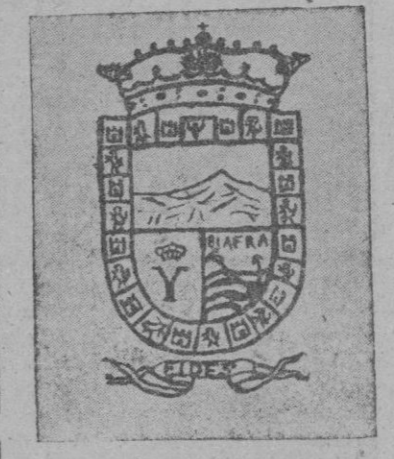
Escudo de armas de Fernando Póo

Allá por el año de Dios de 1778 se hizo a la mar, desde el puerto español de Montevideo, una expedición formada por 150 hombres, al mando del brigadier Conde de Argelejos. No eran sólo soldados los que, temerariamente, se lanzaban a cruzar el Atlántico, que iban con ellos operarios. El término de su empresa era la ocupación de las islas de Fernando Póo y Annobón, que, con los derechos a comerciar libremente con las tribus del continente africano, ubicadas entre el cabo Formoso, en la desembocadura del Níger, y el cabo López, por la parte meridional del río Gabón, nos había cedido Portugal el año anterior al señalado, a cambio de que le devolviéramos la isla de Santa Catalina y la colonia del Sacramento, en tierras americanas, que nuestros marinos habían ocupado en operaciones de represalia. Y ese es el sólido fundamento de nuestros derechos sobre unos territorios del Golfo de Guinea, mucho más extensos que los que forman nuestra Colonia hogaño.