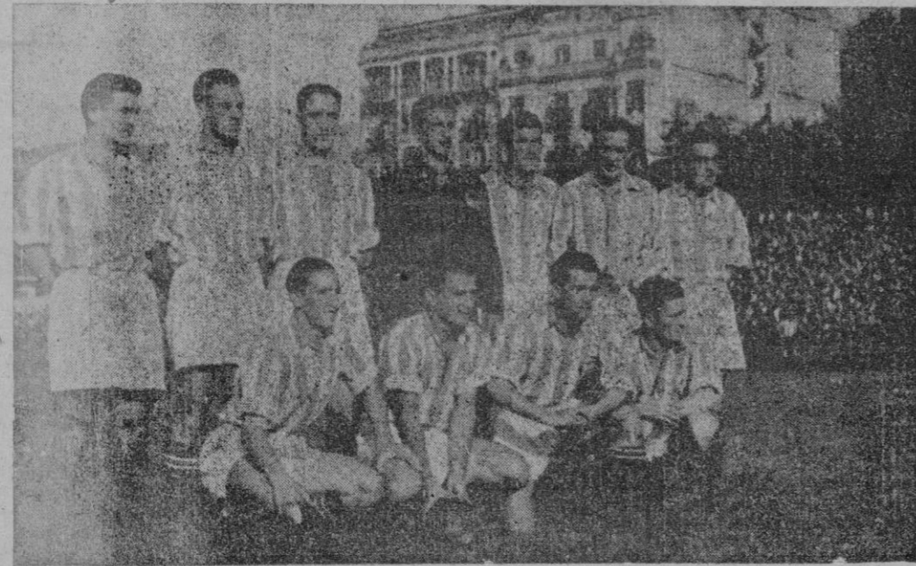
Equipo de la Real Sociedad de San Sebastián, clasificado en forma destacada en el primer puesto del segundo grupo de la Segunda División y que el domingo jugará en casa contra el Constancia.