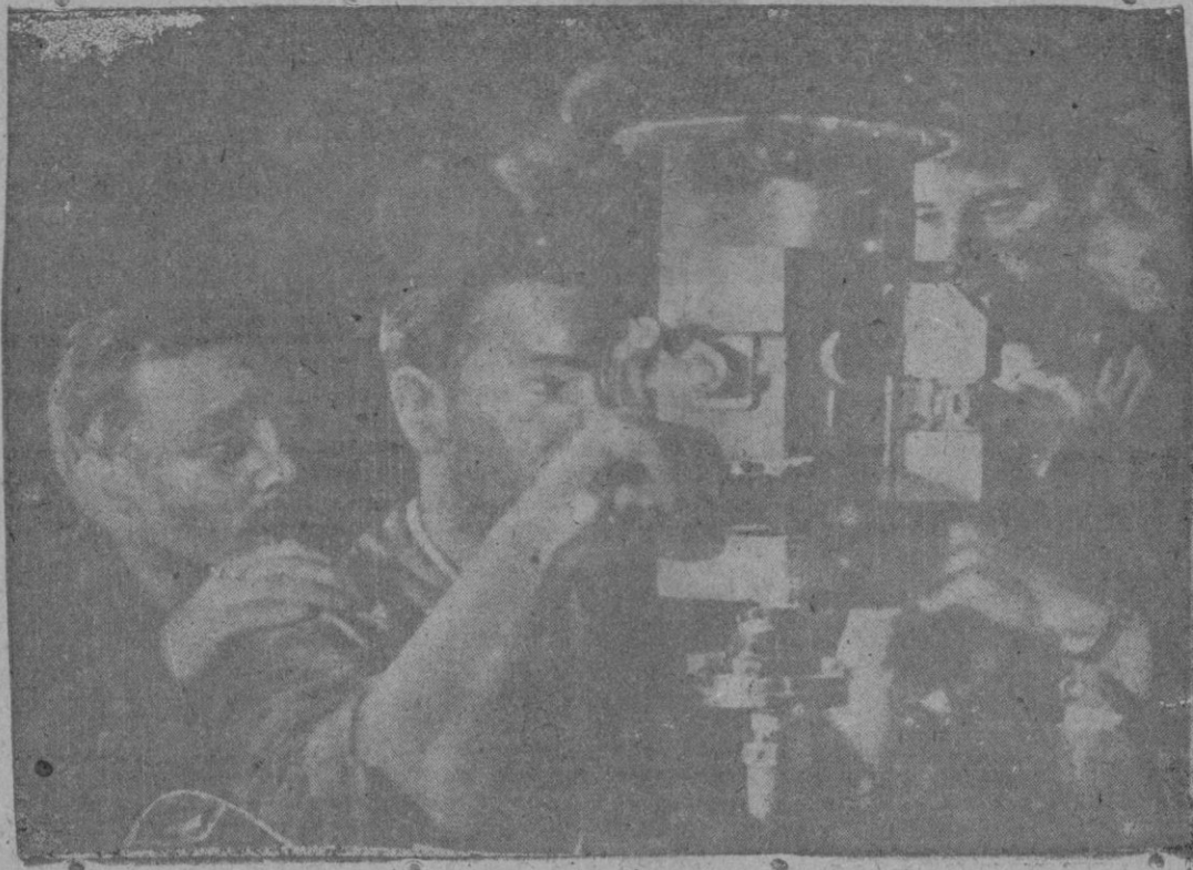
Los héroes del mar. — El comandante de un submarino alemán, atento a la mira de buques enemigos, para torpedearlos.

Comunicado especial del Alto Mando de las fuerzas armadas alemanas: