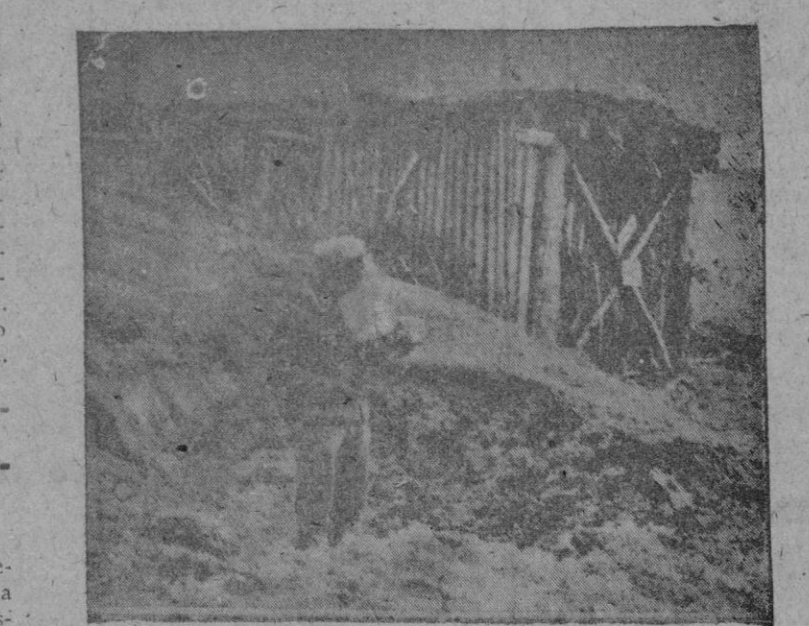
Esta barraca es un cine, levantado por los alemanes, cerca de Stalingrado, donde los soldados, en sus ratos de descanso, se distraen con el celuloide, sin preocuparse de los cañones enemigos, uno de cuyos proyectiles ha abierto un hoyo a la puerta del cine

Al mismo tiempo Timochenko está concentrando refuerzos en Beke-tovka, en Krasno y en Armiensk con el propósito evidente de lanzar un poderoso ataque el próximo día 7.