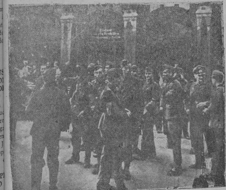
Heridos convalécientes de la División Azul, a las puertas del teatro de Königsberg para asistir a la fiesta celebrada en su honor

Al Sureste del lago Ilmen, han fracasado una vez más los ataques locales de los soviets. Durante el día de ayer la aviación británica efectuó ataques sin objetivo militar sobre la ciudad de Oslo. Los cazas alemanes derribaron a tres de los aparatos agresores. Nuestros bombarderos atacaron, con bombas explosivas e incendiarias, los objetivos de un puesto de la costa Suroeste de Inglaterra."