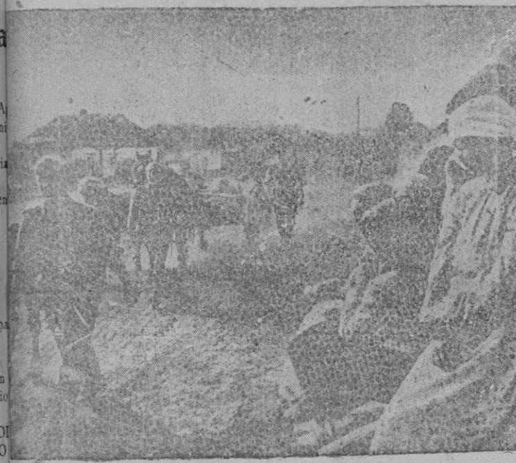
La población de una aldea rusa contempla el paso del victorioso ejército alemán

El optimismo que vive España en esa Internacional de Venecia, al verse elogiada, es obra de los españoles que ya no se resisten cuando se trata de levantar grandiosos estudios y financiar las producciones, no siendo a ello ajeno el Estado con esa acertada disposición y estímulo que ha atinado a darle al cine el carácter de normas conducentes que prestan gran impulso a esta industria nacional.