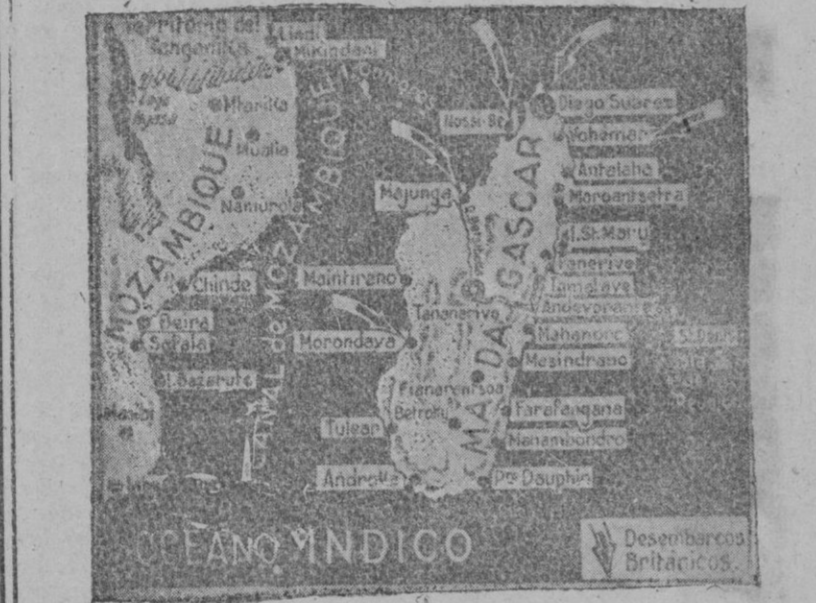
En el gráfico están señalados los puntos de ataque de los ingleses en Madagascar.

A ellos unimos también nuestra felicitación.