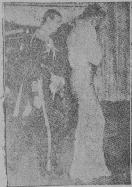
El duque y la duquesa de Kent