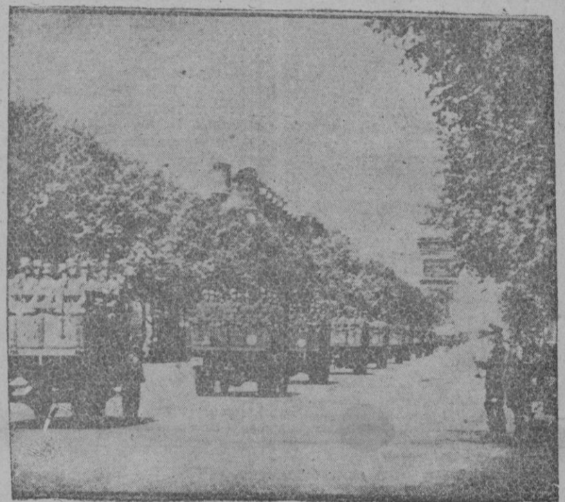
Destacamentos de tropas alemanas que han sido trasladadas del frente del Este a Francia desfilan por las calles de París. La población parisiense se mostró muy impresionada ante este acto militar