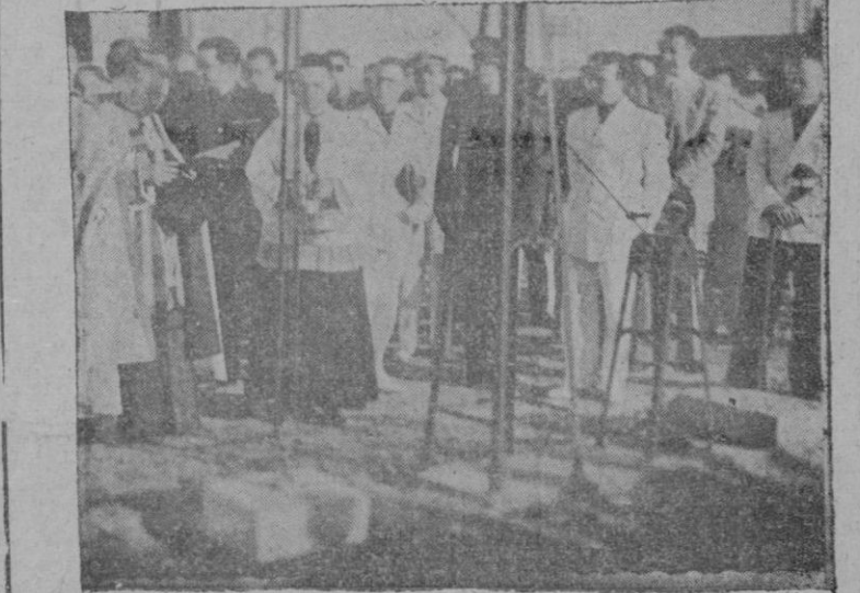
Momento de bendecir la primera piedra de las viviendas protegidas en el Molinar de Levante

El Inspector de Trabajo; el señor Conde de Peralada; la Delegada de la Sección Femenina; el Secretario de la Delegación de Abastecimientos y Transportes; el Director de "Balears"; el Delegado en ésta de la Compañía Transmediterránea; todos los Delegados de Servicios del Partido y otras numerosas jerarquías del Movimiento. LA ALMUDAINA se complace de dar la bienvenida al ilustre huésped.