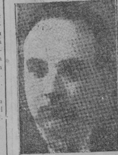
El doctor Castroviejo, insigne oculista español, que ha estado en la Argentina para asistir al Presidente Sr. Ortiz, que, como es sabido, ha renunciado a su cargo de Presidente de aquella República.

Buenos Aires. — Por unanimidad el Congreso argentino ha aceptado la dimisión presentada por el Presidente Ortiz. El Congreso acordó asimismo la sustitución de Ortiz por el Vicepresidente Castillo, quien continuará su mandato hasta febrero de 1944. Castillo ha decidido no efectuar de momento ningún cambio en la constitución del Gobierno. La Vice-Presidencia de la República será desempeñada, hasta que expire el mandato del Presidente Castillo, por Padrón Costa, presidente del Congreso. Servicio telegráfico de la Agencia EFE