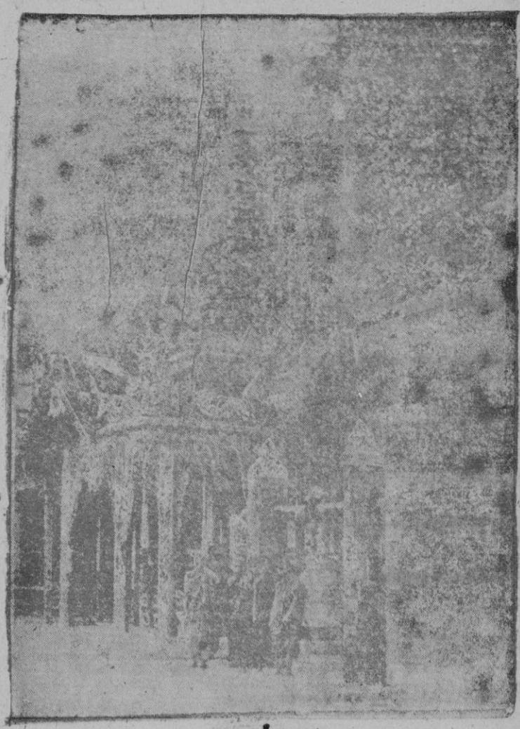
Los ministros del Reich (de izquierda a derecha) Goebbels y Dr. Frick, mariscal general Keitel, gran almirante Raeder y ministro de Relaciones Exteriores, Von Ribbentrop, en el acto del discurso del Führer, en el Reichstag.

Al enviar a V. mi bendición más efusiva, la extiendo también a todos los Asambleístas y elevo al