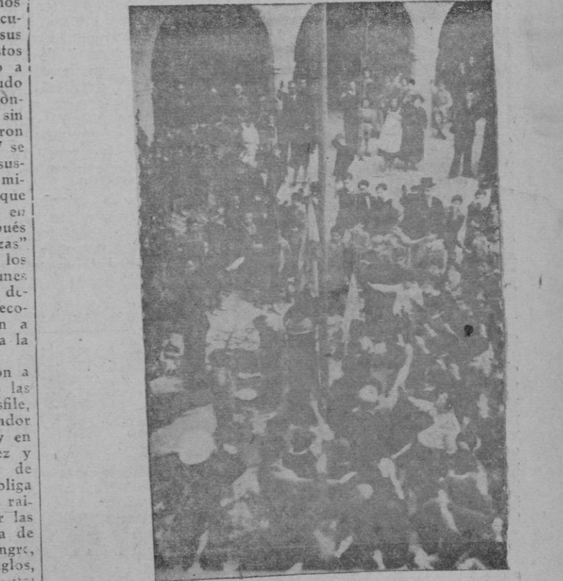
Las Juventudes en el patio del Castillo de Bellver al izar la bandera