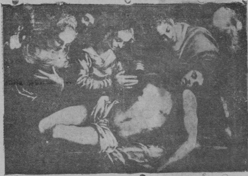
El entierro de Cristo, por Tintoretto