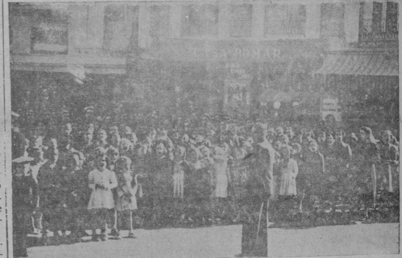
La Juventud cantando en la Plaza de Cort