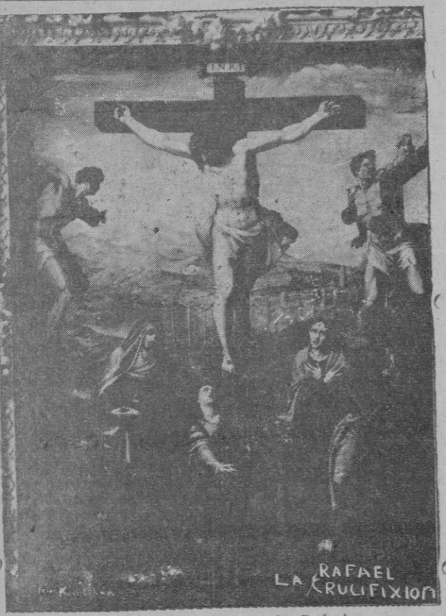
"La Crucifixión", de Rafael