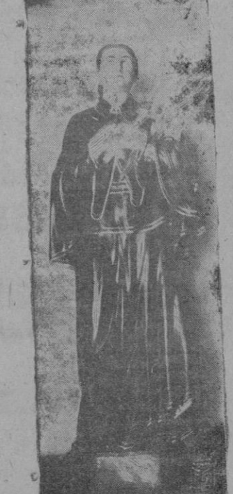
Estatueta de santa Gemma Galgani, de tamaño natural, tallada en madera por el escultor Sr. Vila. Es la primera imagen de esta Santa, recientemente canonizada, que se exhibirá en Mallorca a la veneración pública y que en breve, Dios mediante, será bendecida por el Excelentísimo Sr. Arzobispo-Obispo en la iglesia del Convento de la Concepción de esta ciudad.