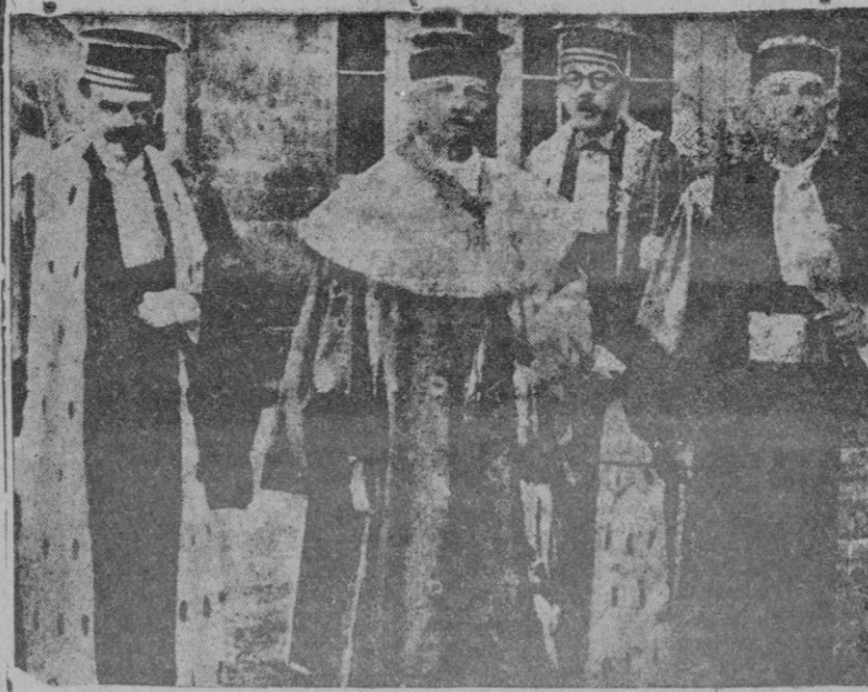
Los cuatro jueces que componen el alto tribunal de Riom

DESEMBARCO NIPON EN JAVA. — SE OCUPA SOEVANG Bandoen. — Oficialmente se anuncia la ocupación por los japoneses de Soevang, situado a 60 kilómetros al N.E. de Bandoen, como consecuencia del desembarco que efectuaron en Indamayau.