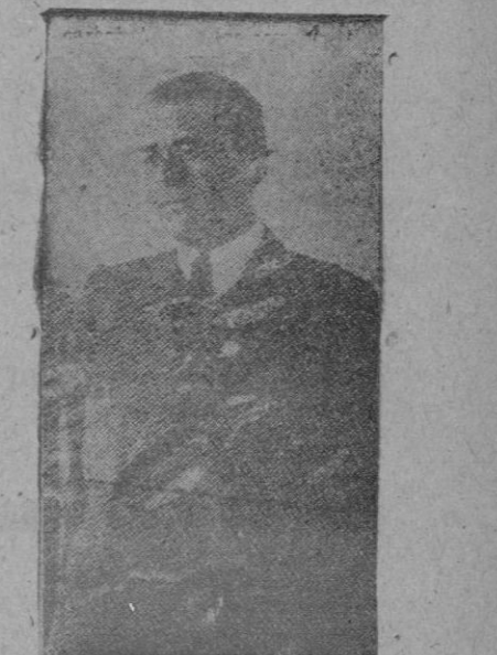
El profesor Speer, jefe supremo de la Arquitectura del Reich, a quien el Führer ha nombrado para sustituir al Dr. Tod