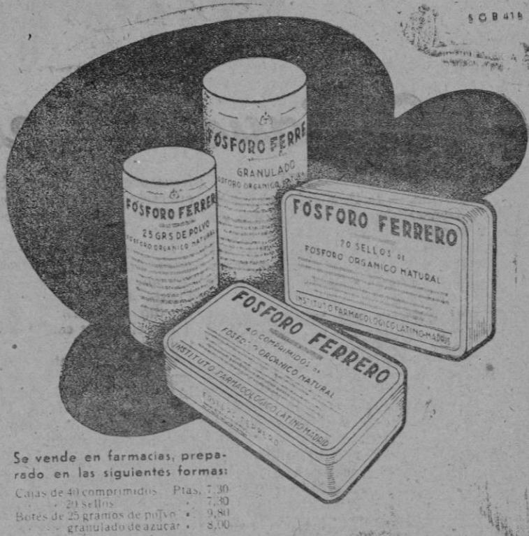
Se vende en farmacias, preparado en las siguientes formas:

SE OFRECEN pisos para alquilar y se venden puertas hierro rollables y de madera para cochería, un molino automático completo con su torre de 14 ms. altura para sacar agua y muebles usados de todas clases. Razón Arquitecto Benassar, 4, junto Plaza Toros, de 9 a 10 y de 1 a 3.