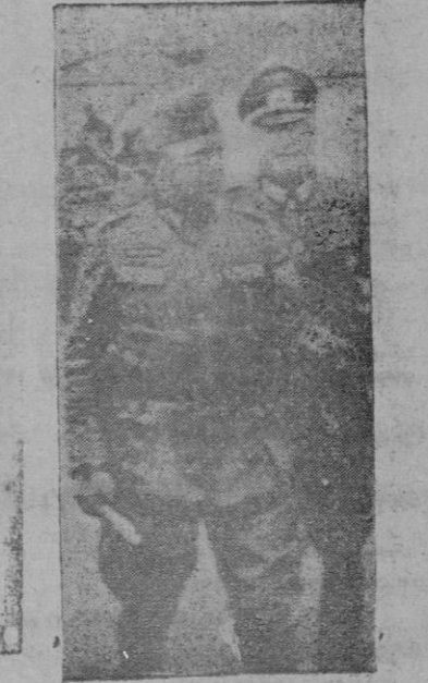
El mariscal alemán Von Reichenau, que tuvo que ser retirado del frente, por sufrir un ataque apoplético, que le arrebató la vida

CARTILLAS INFANTILES Hoy día 24 de los corrientes, en el Apartado de Abastos de este Excmo. Ayuntamiento, se procederá al reparto de las cartillas infantiles, cuyas instancias fueron presentadas el día 27 de Octubre próximo pasado.