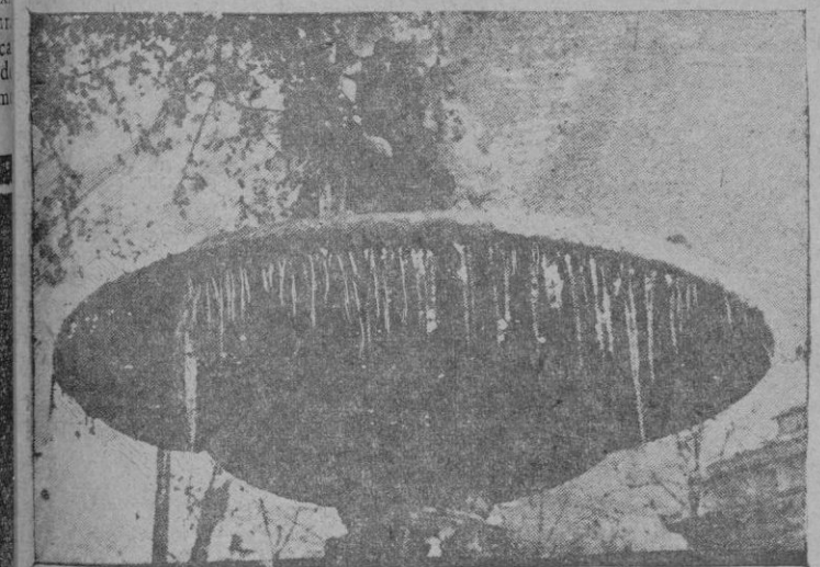
La actualidad: nieve. En el tazón del surtidor el agua se ha vuelto cristal. Las estalactitas de las cuevas, se prodigan por el frío

Los beneficiados por esta medida del Gobierno, que son centenares de facultativos esparcidos por todo el territorio patrio, preparan un homenaje en que quede patente la gratitud de esta clase médica, abnegada y llena de celo muchas veces mal comprendido, hacia quien ha hecho posible la solución del viejo problema, demostrando con ello que la justicia social y el cuidado sanitario, de tanta importancia para las generaciones futuras, son elementos preferentes en quienes tienen en sus manos la dirección del Estado.