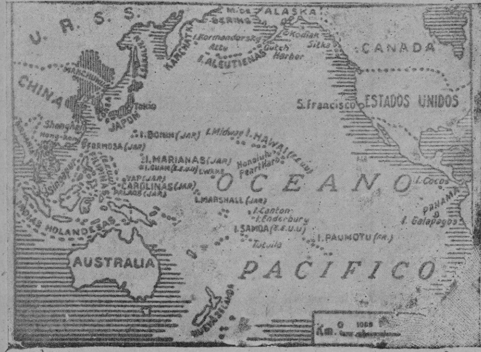
Mapa completo del nuevo teatro de la guerra

Japoneses ocupan un importante punto estratégico de Malasia. - Los ingleses y japoneses luchan en territorio thailandés. - Aiza la bolsa de Tokio. - Chai Kai Shek declara la guerra al Japón, Alemania e Italia. El gobierno griego refugiado en Londres declara la guerra al Japón. Texto de la declaración de guerra del Mikado. Los japoneses a pocos kilómetros de Manila. - Según Roosevelt la guerra será dura y larga. - Submarino yanqui a pique