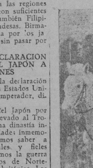
El Emperador del Japón durante una revista a las tropas

— Sobre tierra, dos millones de soldados japoneses están en China. Sólo el Ejército japonés de primera línea cuenta con cuatro millones quinientos mil hombres, de donde resulta la posibilidad de ocupar, si fuera menester, partiendo del Manchukuo y Corea, las provincias rusas del Asia Oriental, debilitadas por el envío de la mayor parte de